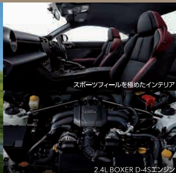
スポーツフィートを極めたインテリア

ついにMT車にも待望のアイサイト搭載。中でもドライバーの操作に配慮した追従機能付クルーズコントロールの制御は必見。