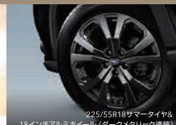
225/55R18サマータイヤ&18インチアルミホイール(タークメタリック塗装)

AWDリニアトロニック[SKEFSBL91]車両本体価格3,377,000円 ポース併用34回払い(1月契約、3月支払い開始、ポース月[8-1月]契約走行キロ数1,000km/月間プランの場合)●頭金977,000円●所要資金2,400,000円●初回お支払い額12,533円1回●月々お支払い額11,700円×32回●ポース時加算額98,000円×5回●頭金+初回～33回までのお支払い額合計1,853,933円●最終回(34回)お支払い額:新車代替・車両返却の場合0円/残債額一括払いの場合1,688,000円(お支払い総額3,541,933円)●残債率55%