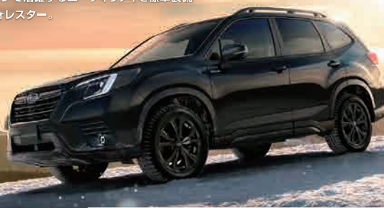
PHOTO: X-EDITION クリスタルブラックシルカ ※写真は撮影用にスタジオライティングを装着しています。X-EDITIONには225/55R18 サマータイヤ(ブリヂストン DUELER)が装着されます。

フォレスター X-EDITION [FORESTER Touring特別仕様車] 2.0L DOHC 直噴+モーター(e-BOXER) 車両本体価格 リニアトロニック AWD(常時全輪駆動) (消費税10%込) 3,377,000円