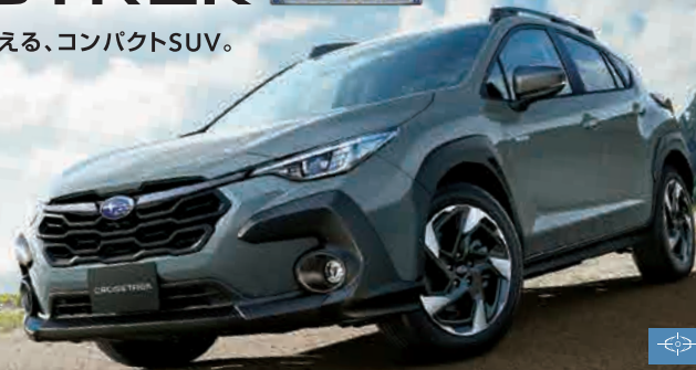
PHOTO: Limited (AWD車) オプションブルーメタリック(33,000円高・消費税10%込) ルーフラール、サンルーフ、ナビゲーション機能、フロントシートヒーター、ステアリングヒーターはメーカー装着オプション(280,500円高・消費税10%込)

クロスレック Limited 2.0L DOHC 直噴+モーター(e-BOXER) リニアトロニック FWD/AWD(常時全輪駆動)