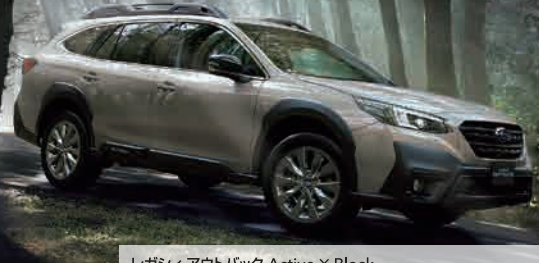
PHOTO: Active X Black カシミアゴールドオーバル(33,000円高・消費税10%込) サンルーフ、ハーマンカードサウンドシステムはメーカー装着オプション(242,000円高・消費税10%込)

レガシアウトバック Active X Black [レガシアウトバックLimited EX特別仕様車] 1.8L DOHC 直噴ターボ "DIT" リニアトロニック AWD(常時全輪駆動) 車両本体価格 (消費税10%込) 4,510,000円