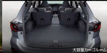
大容量カーゴルーム