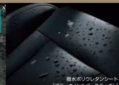
撥水ホリウレタンシート [ブラック(シルバーステッチ)]

AWDリニアトロニック[BTSDS58-SJ]車両本体価格4,510,000円 ポース併用34回払い(1月契約、3月支払い開始、ポース月[8-1月]契約走行キロ数1,000km/月間プランの場合)●頭金1,310,000円●所要資金3,200,000円●初回お支払い額18,493円1回●月々お支払い額16,900円×32回●ポース時加算額113,000円×5回●頭金+初回～33回までのお支払い額合計2,434,293円●最終回(34回)お支払い額:新車代替・車両返却の場合0円/残債額一括払いの場合2,378,000円(お支払い総額4,812,293円)●残債率58%