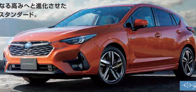
PHOTO: ST-H(AWD車) サンブレイスパール(33,000円高・消費税10%込) ステアリングヒーター、ナビゲーション機能、サンルーフはメーカー装着オプション(225,500円高・消費税10%込)

インプレッサ ST-H 2.0L DOHC 直噴+モーター(e-BOXER) リニアトロニック FWD/AWD(常時全輪駆動)