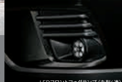
LEDフロントフォグランプ (丸型6灯)