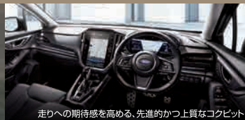
走りへの期待感を高める、先進的かつ上質なコクピット

3つの瞳に進化した新世代アイサイトが提供する安心感はもちろん、最新テクノロジーによって実現した高度運転支援システムの快活さもこの機会に。