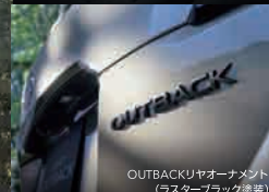
OUTBACKリヤオーナメント(ラスタブラック塗装)