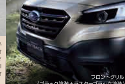
フロントグリル(ブラック塗装+ラスタブラック塗装)