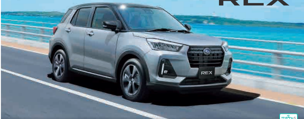
PHOTO：ブラックマイカメタリック / スムースグレーマイカメタリック(55,000円高・消費税10%込) スマートフォン連携9インチディスプレイオーディオ、パノラミックビューモニターはメーカー装着オプション(82,500円高・消費税10%込)