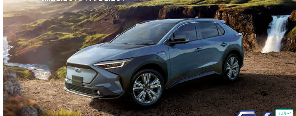
PHOTO：ハーバーミストグレーパール(55,000円高・消費税10%込) ルーフレール、パノラマムーンルーフはメーカー装着オプション(220,000円高・消費税10%込)