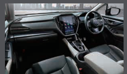
PHOTO(左・右):アステロイドグレーパール(有料色) 本革シート[ブラック/アッシュ(カッパーステッチ)],サンルーフ,スマートリヤビューミラーはメーカー装着オプション

レイバックでは、乗る人すべてがゆったりとリラックスできる上質な空間を目指しました。ブラックとアッシュカラーのコントラスト、カッパーステッチのアクセントが、明るく華やかなインテリアを演出。大画面のセンターディスプレイなどの先進的な機能も充実させ、使い勝手の良さにもこだわりを注いでいます。