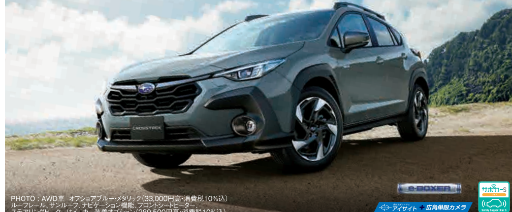
PHOTO：AWD車 オフショアブルーメタリック(33,000円高・消費税10%込) ルーフレール、サンルーフ、サヒゲーション機能、フロントシートヒーター、ステアリングヒーターはメーカー装着オプション(280,500円高・消費税10%込)