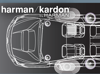
●ハーマンカードン、harman/kardonはHarman International Industries Inc.の登録商標です。

世界的高級オーディオメーカー「HARMAN」の伝統ある旗艦ブランド、ハーマンカードンの10スピーカーシステムを標準装備。荷室空間を犠牲にしないサブウーファーレスとしつつ専用の音作りを施すことで、コンサートの生演奏のような臨場感あふれるステレオサウンドを実現しています。