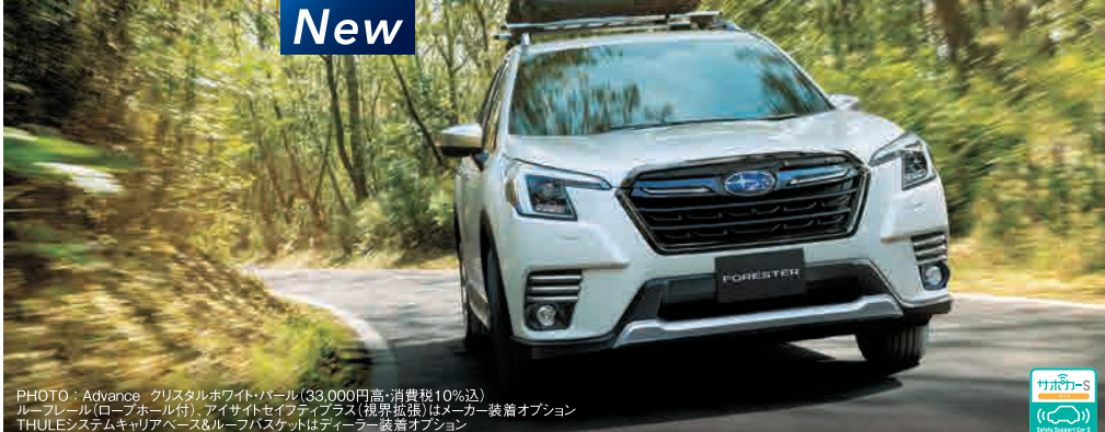
PHOTO：Advance クリスタルホワイトパール(33,000円高・消費税10%込) ルーフレール(ローホルル付)、アイサイトセグメントプラス(視界拡張)、メーカー装着オプション THULEシステムキャリアベース&ルーフバスケットはメーカー装着オプション