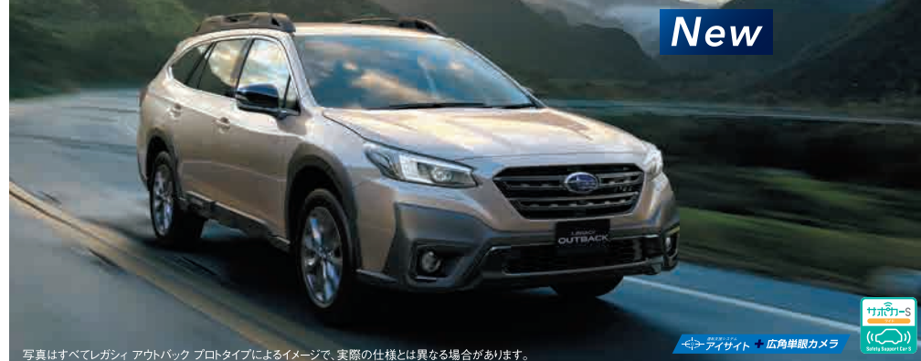
写真はすべてレガシィアウトバックプロトタイプによるイメージで、実際の仕様とは異なる場合があります。