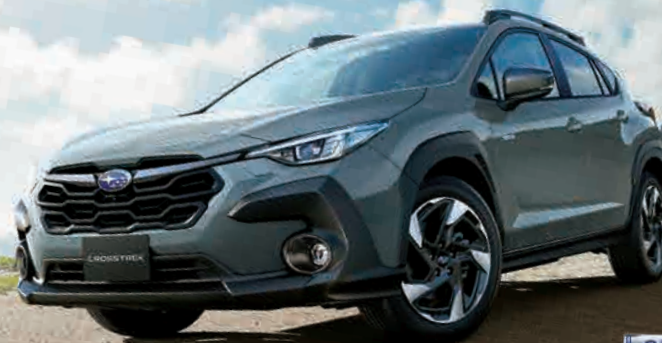
PHOTO: AWD車 オフショアブルーメタリック(33,000円高・消費税10%込) ルーフレール、サンルーフ、ナビゲーション機能、フロントシートヒーター ステアリングヒーターはメーカー装着オプション(280,500円高・消費税10%込)