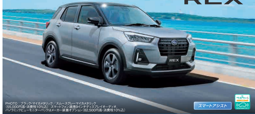
PHOTO:ブラックマイカメタリック/スモークグレーマイカメタリック (55,000円高・消費税10%込) スマートフォン連携9インチディスプレイオーディオ、 パノラミックビューモニターはメーカー装着オプション(82,500円高・消費税10%込)