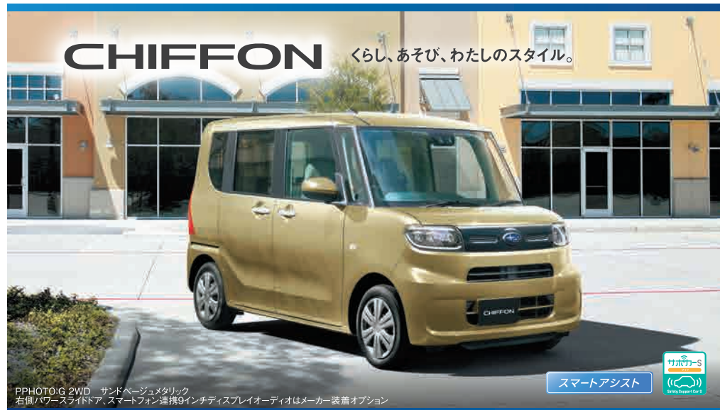
PHOTO:G 2WD サンドベージュメタリック 右側パワースライドドア、スマートフォン連携9インチディスプレイオーディオはメーカー装着オプション