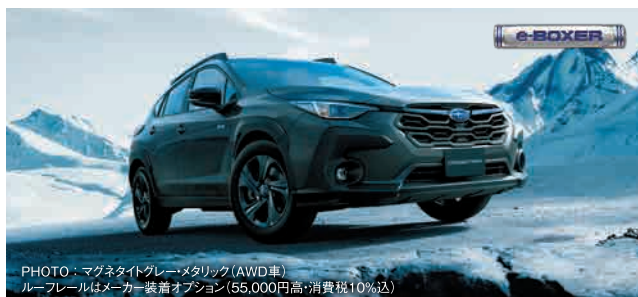
PHOTO: マグネタイトグレー・メタリック (AWD車) ルーフレールはメーカー装着オプション (55,000円高・消費税10%込) 2.0L DOHC 直噴+モーター(e-BOXER) リニアトロニック AWD/FWD 車両本体価格(消費税10%込) FWD 2,662,000円