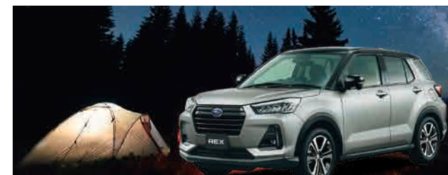
PHOTO: (上) ブラック・マイカメタリック / スムースグレー・マイカメタリック (55,000円高・消費税10%込) (下) レーザーブルー・クリスタルシャイン (33,000円高・消費税10%込) 1.2L CVT 2WD 車両本体価格(消費税10%込) 2,171,100円