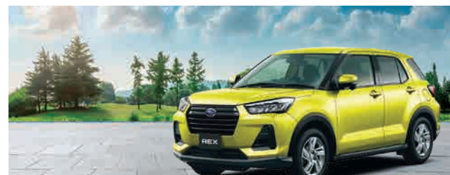
PHOTO: (上) マスタードイエロー・マイカメタリック (下) ナチュラルベージュ・マイカメタリック 1.2L CVT 2WD 車両本体価格(消費税10%込) 1,820,000円