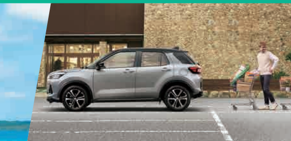
PHOTO: Z ブラック・マイカメタリック / スムースグレー・マイカメタリック (55,000円高・消費税10%込) スマートフォン連携9インチディスプレイオーディオ、パノラミックビューモニターはメーカー装着オプション (82,500円高・消費税10%込)