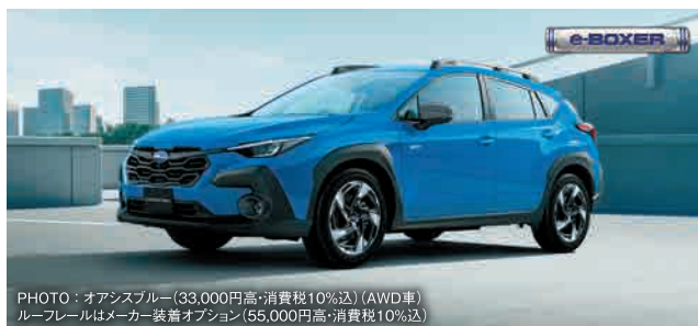
PHOTO: オアシスブルー (33,000円高・消費税10%込) (AWD車) ルーフレールはメーカー装着オプション (55,000円高・消費税10%込) 2.0L DOHC 直噴+モーター(e-BOXER) リニアトロニック AWD/FWD 車両本体価格(消費税10%込) FWD 3,069,000円