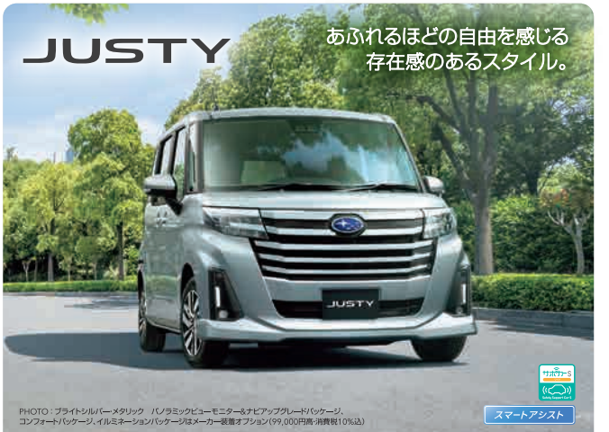
PHOTO:フレイッシュブルーメタリック パノラミックビューモニター&ナビゲーションシステム、コンフォートパッケージ、イルミネーションパッケージはメーカー装着オプション(99,000円高・消費税10%込)