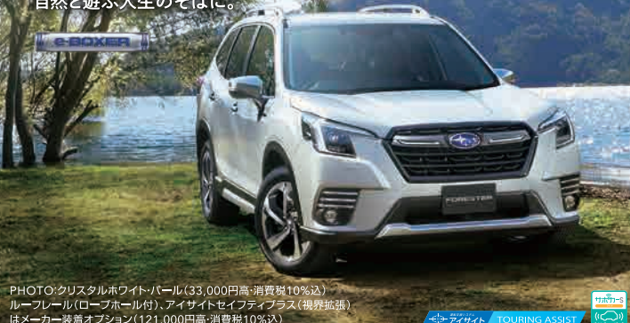
PHOTO:クリスタルホワイトパール(33,000円高・消費税10%込) ルーフレール(ローフホール付)、アイサイトセーフティプラス(視界拡張)はメーカー装着オプション(121,000円高・消費税10%込)