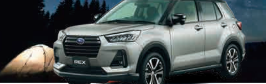
PHOTO: (上) ブラックマイカメタリック/スムースグレーマイカメタリック(55,000円高・消費税10%込) (下) レーザーブルークリスタルシャイン(33,000円高・消費税10%込)