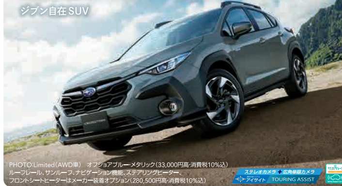
PHOTO: Limited (AWD車) オプションブルーメタリック(33,000円高・消費税10%込) ルーフレール、サンルーフ、ナビゲーション機能、ステアリングヒーター フロントシートヒーターはメーカー装着オプション(280,500円高・消費税10%込)